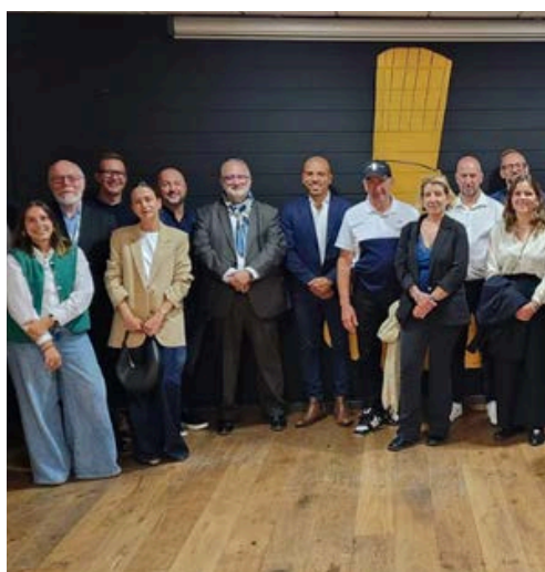
Une mission économique porteuse à Lyon