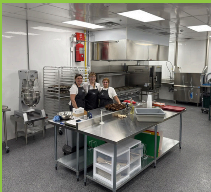
Une cuisine commerciale accessible aux entreprises de la Haute-Yamaska