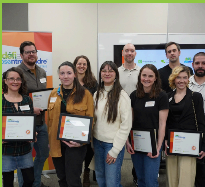
L'entrepreneuriat se porte bien en Haute-Yamaska