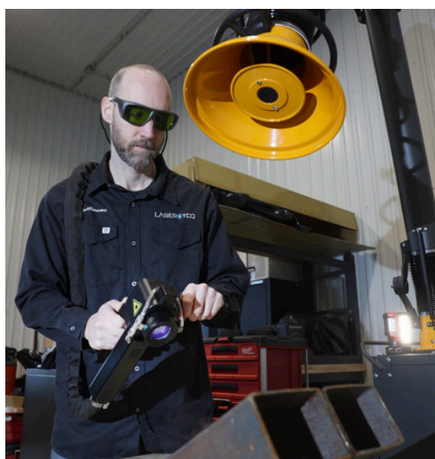
Le laser, l'avenir du décapage au Québec?