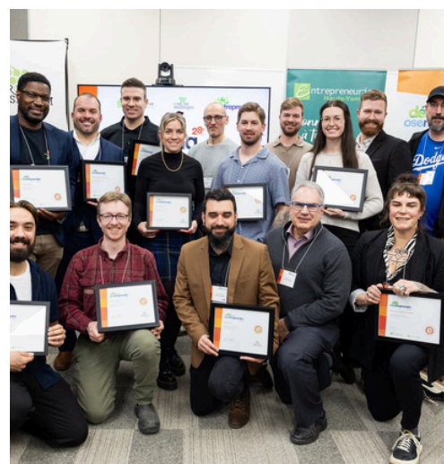
Les lauréats 2026 du volet régional du Défi OSEntreprendre dévoilés