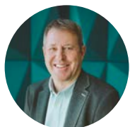
Éric Chagnon Maire de Shefford